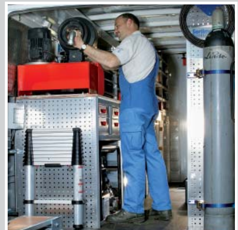
Der HydroBär-Servicetechniker bei der Anfertigung von Hydraulikschlauchleitungen.