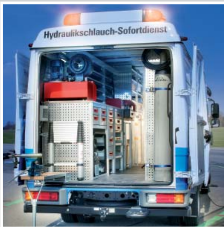
Die mobile HydroBär-Werkstattausrüstung für noch mehr Service und Sicherheit in Ihrem Arbeitsalltag.

Die mobile HydroBär-Dienstleistungspalette reicht von der Fehlerdiagnose und der Anfertigung von Hydraulikschlauchleitungen bis NW40/4 bis hin zum fachgerechten Ersetzen. Hierbei können Saugleitungen, Tank- und Leckleitungen, 2- und 4-Draht-Druck- sowie Kraftstoffleitungen gefertigt werden. Die von der Bordelektrik unabhängige zusätzliche Stromversorgung gewährleistet überall die Einsatzbereitschaft des flexiblen Service-Systems.